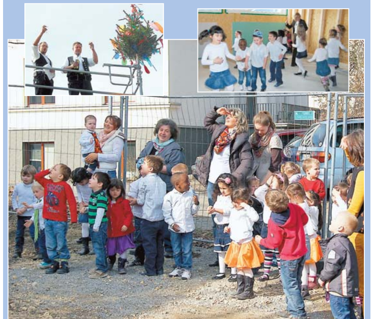
Mit einem fröhlichen Fest feierten Kinder, Eltern, Handwerker und Gäste das Richtfest der Kindertagesstätte Twielfeld. Die Kleinen führten Tänze auf, sangen eigens für diesen Anlass geschriebene Lieder und äußerten viele gute Wünsche für die Zukunft ihrer Kita. Für zwei neue Gruppen entsteht Raum in Passiv-Bauweise. Ab 1. September können die „Unter-Dreijährigen“ dann kommen. Der Anbau gliedert sich in zwei Geschosse (EG und OG) und erfolgt in Holzbauweise. Die Kita wird über das Nahwärmenetz des Krankenhauses mit Energie versorgt. Die Baukosten belaufen sich auf 1,2 Millionen Euro.