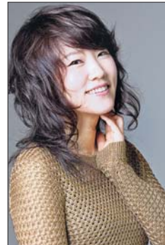
Youn Sun Nah gastiert beim Jazz Club Singen

das meistverkaufte Jazzalbum des Jahres 2011 und sie erhielt dort weitere große Auszeichnungen, zum