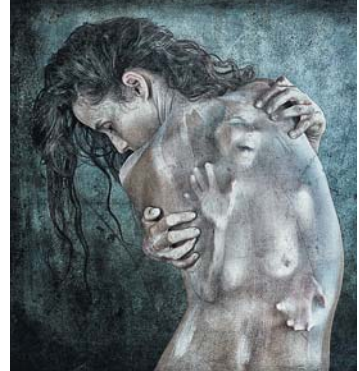
Foto „Zwei Seelen“ Interpretation des Künstlers: Es entwickelt sich etwas in unserem kollektiven Inneren, von außen durch imaginäre Angst geschürt.