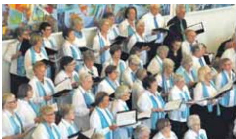
Der Seniorenchor sorgte mit seinem Gesang für vergnügliche Stunden.

Noch mehr Fotos unter: wochenblatt.net/bilder