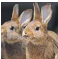
Die schönsten Mümmelmänner werden in Gottmadingen zu sehen sein.

Am Wochenende des 4. und 5. November findet in Gottmadingen die große Kreiskaninenschau des Kreisverbandes Konstanz e.V. statt. In der Eichendorffhalle in Gottmadingen werden die Züchter des KV Konstanz rund 350 Tiere in über 50 Rassen und Farbschlägen zur Schau stellen. Die Kleintierzüchter dieser Region wollen sich hiermit präsentieren und der Bevölkerung zeigen, dass die Liebe zum Tier und der Natur ein sehr schönes Hobby sein kann. Ausrichter der Schau ist der Kleintierzuchtverein C560 Gottmadingen. Am Freitag werden sechs qualifizierte Preisrichter die Mümmelmänner nach den Richtlinien des ZDRK begutachten und bewerten. Ausschlaggebend für eine hohe Punktzahl sind Gewicht, Form, Fellzustand, Farbe und Pflegezustand. Am Samstag wird die Kreisschau ab 9 Uhr geöffnet sein. Auch am Sonntag werden von 10 bis 17 Uhr viele Besucher erwartet, dann ist um 15 Uhr die Ehrung der verschiedenen Kreismeister. An beiden Ta-