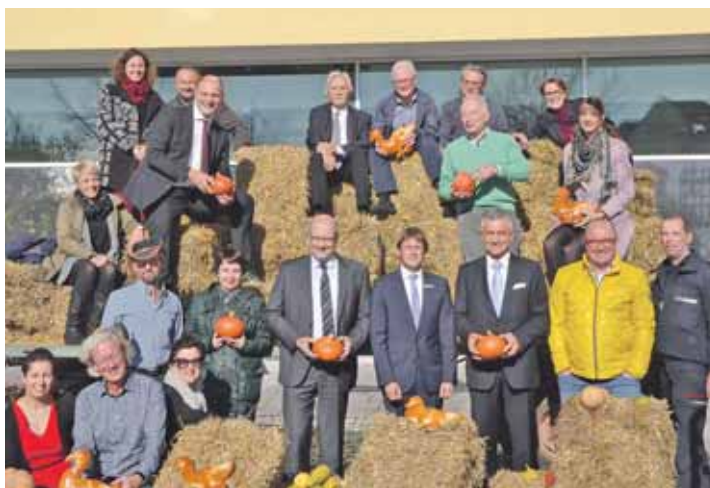
Die »Macher« hinter der »Marke« Martini freuen sich schon jetzt auf den verkaufsoffenen Sonntag mit Martinimarkt und neu gestaltetem Martinsumzug.

Zwischen 13 und 18 Uhr wird der Handel sowohl in der Innenstadt als auch im Singener Süden mit seiner vielfältigen Qualität wieder Kunden aus den Regionen Waldshut, Tuttlingen, Überlingen und natürlich der Schweiz nach Singen locken. Denn die Mischung aus inhabergeführten Einzelhandels-geschäften und bekannten Fila-