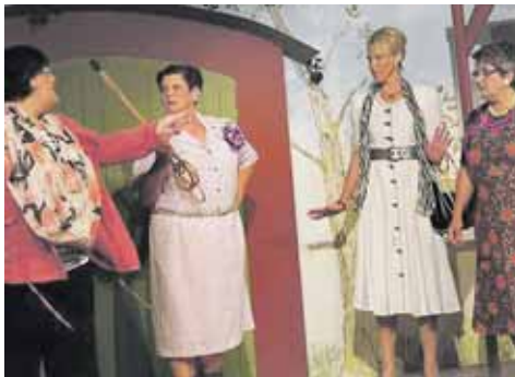
Die Akteure der Mundartbühne Worblingen besuchten den Zuschauern vier amüsante Aufführungen. sub-Bild: ver