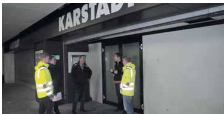
Beim Ortstermin in der ehemaligen Bahnhofstraßenunterführung wurden nun durch die Vertreter des Straßenbaus der Stadt Singen und des Unternehmens »Bau GmbH Herrischried« die technischen Details der Verfügung besprochen, die Ende November beginnen soll.

Noch mehr Fotos unter: wochenblatt.net/bilder