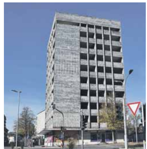
Ein Anblick, den die Singener noch länger als geplant sehen werden: Das entkernte Conti-Hochhaus wartet auf den Abriss.

gen lassen, das Kezic nun vorliegt. »Wir nehmen die Sicherheitsbedenken seitens der Spezialfirma sehr ernst und prüfen derzeit das vom Unternehmen