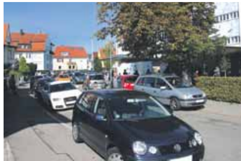
Das tägliche Verkehrsszenario vor der Waldeck-Schule ist nicht nur der Schulleitung ein Dorn im Auge.