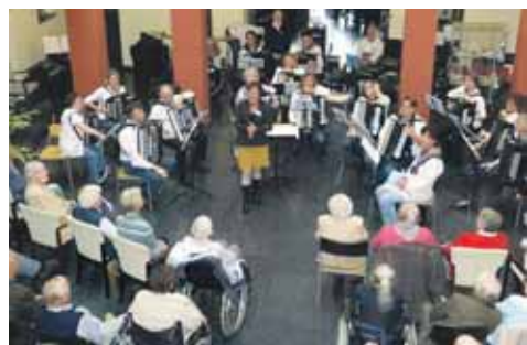
Wahrlich – Musik verbindet – die Menschen – überall und zuletzt im St. Verena. Wir freuen uns auf das nächste Mal! sub-Bild: Akkordeon-Spielring