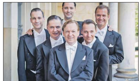
21. Januar: Berlin Comedian Harmonists

nergebnis aus umarrangierten Jazztiteln, Varietéliedern und bekannten Filmsongs, vorgetragen in perfektionierter Mehrstimmigkeit, verhalf dem Ensemble zu einer immensen Popularität in ganz Europa und darüber hinaus. Auf dem Höhepunkt ihres Erfolgs gaben