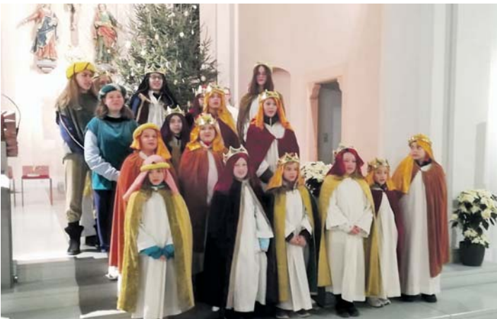
Die Starnsinger von Überlingen am Ried sammelten 4.400 Euro.