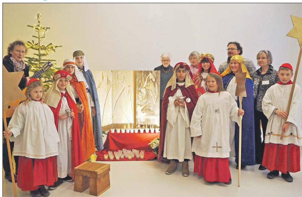
Es ist schon Tradition, dass die Sternsinger von der Pfarrei St. Peter und Paul das Klinikum besuchen, um den Patienten und dem Haus den Segen zu überbringen. Zwei Sternsinger-Gruppen kamen auf alle Krankenstationen. Der Segensgruß wurde auch an die Türe der Klinikkapelle angebracht. Zum Abschluss sangen die jungen Leute im Café Lichtblick, wo sie von zahlreichen Besuchern erwartet wurden.