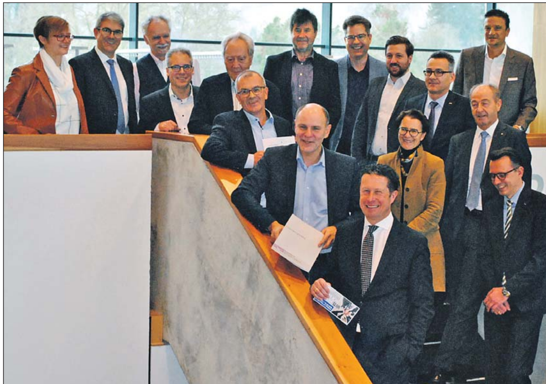
Sponsoren und Organisatoren freuen sich auf das 9. Wirtschaftsforum am Dienstag, 17. März, in der Stadthalle Singen.

Um 19.30 Uhr beginnt die für alle Interessierten offene Abendveranstaltung „Faktoren für den Erfolg und Misserfolg von Teams“ mit Stefan