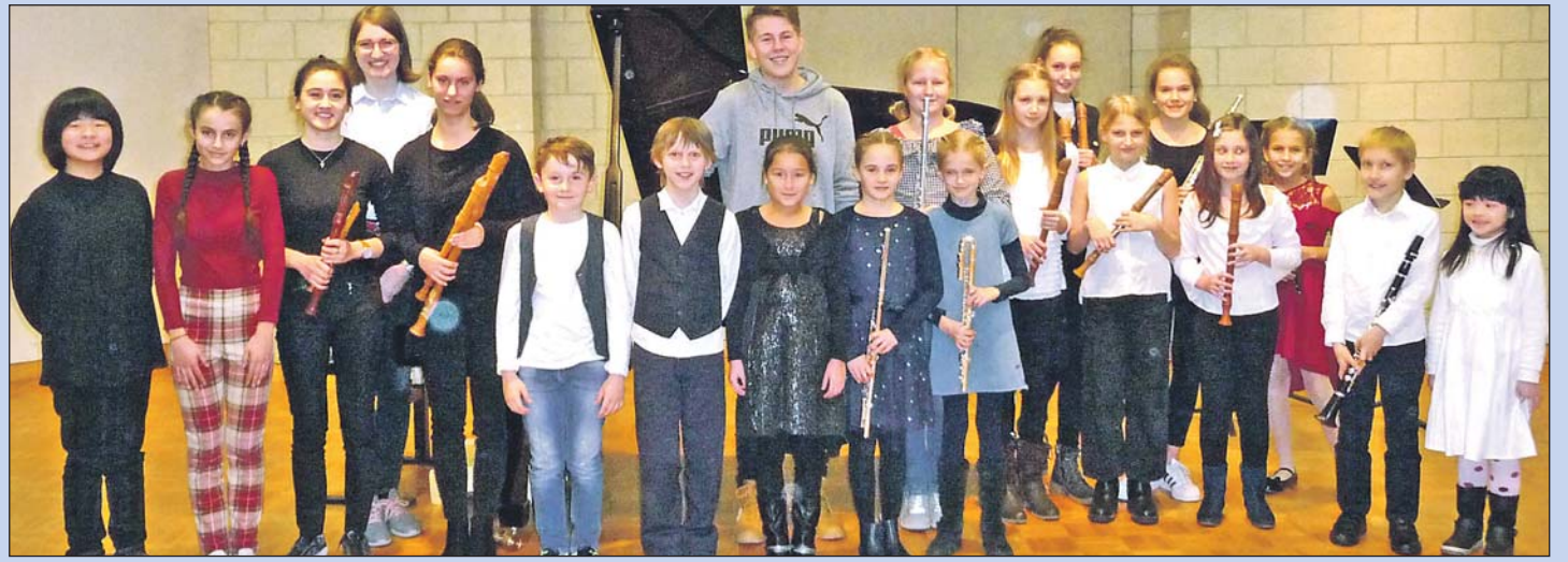
Teilnehmer der Jugendmusikschule Singen bei „Jugend musiziert“.

Wer den Vortrag beruflich besucht (Betreuungsassistenten, Alltagsbegleiter, Nachbarschaftshelfer etc.), erhält eine Teilnahmebescheinigung. Außerdem gibt es für alle Besucher eine Infobroschüre zum Mitnehmen.