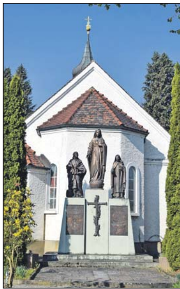
Die Theresienkapelle in Singen – rundherum ein Blickfang.

Die Kapelle entstand 1946 bis 1947 unter der fürsorglichen Leitung von Jean le Pan de Ligny, dem damaligen französischen Kommandanten des Kriegsgefangenenlagers. Entwurf, Er-