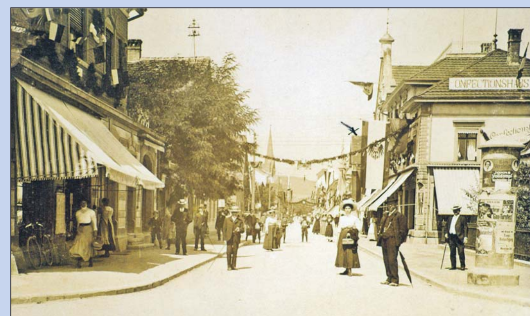
Die Singener Scheffelstraße mit ihren Firmen um 1912.

Das SINGEN Jahrbuch 2020 ist zum Preis von 10,80 Euro im Stadtarchiv, in den Buchhandlungen Greuter und Lesefutter, in der Marktpassage sowie über den Verlag MarkOrPlan erhältlich.