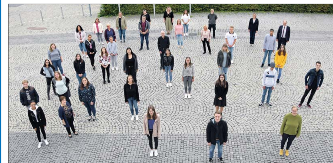
37 junge Frauen und Männer haben am 1. September bei der Stadt Singen ihre Ausbildung begonnen. Oberbürgermeister Bernd Häusler begrüßte sie im Ratssaal und wünschte allen viel Erfolg für den neuen Lebensabschnitt. Auf dem Rathausplatz kamen alle für ein gemeinsames Foto zusammen – selbstverständlich mit dem nötigen Corona-Sicherheitsabstand.