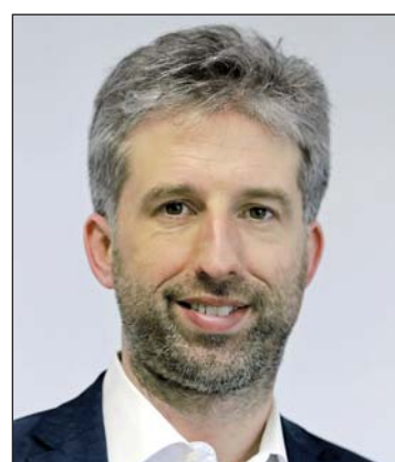
Eine Talkrunde mit Tübingens OB und Grünen-Politiker Boris Palmer am 22. September eröffnet den Veranstaltungsbetrieb der Stadthalle.

Fortgesetzt wird die „WissensWert“-Reihe in der Stadthalle Singen am Dienstag, 13. Oktober, um 20 Uhr mit einem Vortrag des Buchau-