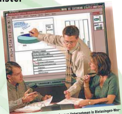
Media-Brain ist einer der vielen jungen Unternehmen in Rielasingen-Worblingen. Sie nutzen das Industriefenster unter dem Dach der Worblingler Hardberghalle.

Am Sonntag geht es um 11 Uhr los. Um 13.30 Uhr wird dann die Tae Bo Gruppe des TV Rielasingen auftreten. Im Augenbereich gibt es an beiden Tagen eine Menge zu sehen. Das Autohaus Scheu wird die neuen Modelle zeigen, Alicke wird wieder zeigen, was ein Karosseriebauer alles kann. Türen und Treppen sind hier ebenso ein wichtiges Thema.