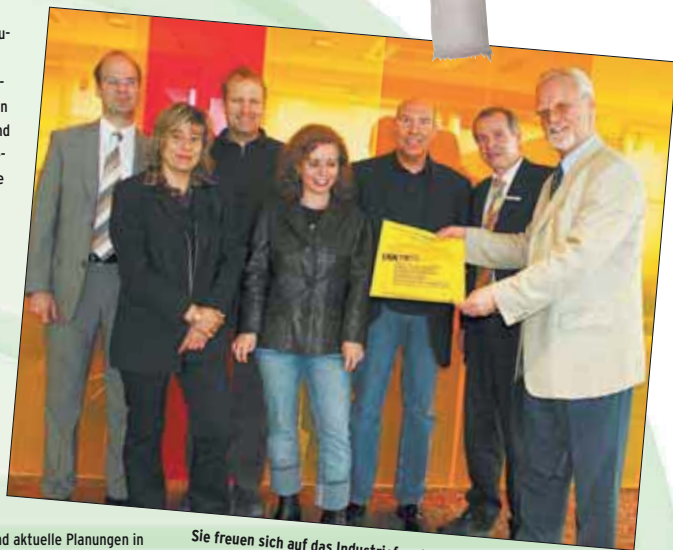
Sie freuen sich auf das Industriefenster 2006, die Vorstandschaft des Handel und Gewerbevereins Rielasingen-Worblingen.

Die Idee ist überzeugend: Vier Schwerpunkte hat die Leistungsschau: Drinnen die Präsentation und das kompetente Gespräch, draußen die kraftvollen Demonstrationen, auf dem Sportplatz Vergnügen für die Kinder und Jugendlichen und dann zwischen der Halle und der Schule ein Flohmarkt der professionellen Dimension. Auch die Gemeinde wird mit einem Stand dabei sein und aktuelle Planungen in Rielasingen-Worblingen vorstellen.